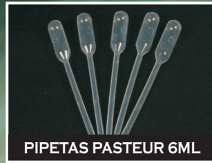
PIPETAS PASTEUR 6ML

Presentamos nuestra linea de accesorios para laboratorio como : Microtubos, crioviales, pipetas pauster rack para microtubos, etc; procedencia Italiana.