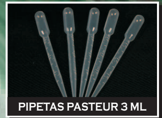
PIPETAS PASTEUR 3 ML